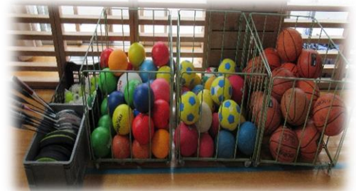
体育委員が毎日整頓している運動用具