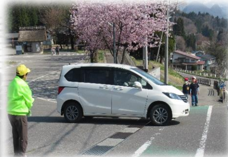
1. 2年交通安全教室～路上練習～