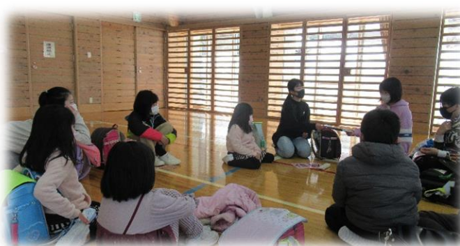
地区児童会登校班顔合わせ

新入生を始め子ども達は、4月中、朝の活動を使ったガイダンスにより、登下校、学習、給食、清掃、生活のきまり、「小谷っ子タイム」などについて、それぞれの活動に見通しを持って小学校生活が送れるように確認しました。また、8日（金）の集団下校を始め、4月中の集団登校では5、6年生の登校班リーダーが各登校班をまとめて、安全な登下校を行っています。その他、避難訓練や交通安全教室、児童会を中心とした1年生を迎える会などの行事がありましたが、どれも子ども達一人一人が自分で考えたり対話したりしながら、主体的に取り組む姿は、正に「一人一人がいきいき輝く小谷っ子」の姿であったと思います。