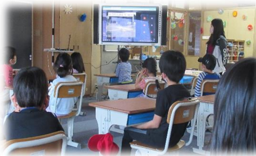
一生懸命ガイダンスを聴く1年生